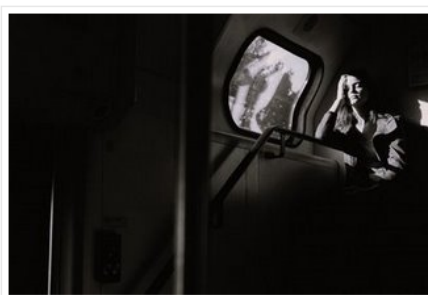
Imagem: Marcos Sêmola.

Segue o trem Sob o mundo Leva consigo o escuro E nossas dúvidas