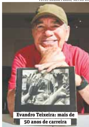
Evandro Teixeira: mais de 50 anos de carreira

Ele, que já registrou fatos e ícones mundiais, de Carnavais a golpes militares, de Ayrton Senna à Rainha Elizabeth, é enfático ao dizer que "o Brasil tem a melhor fotografia do mundo".