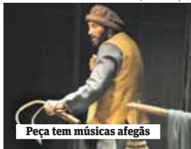
Peça tem músicas afegãs

Teatro ► "Kabul". Espetáculo da "Trilogia da Guerra", da companhia Amok, promove um mergulho no Afeganistão.