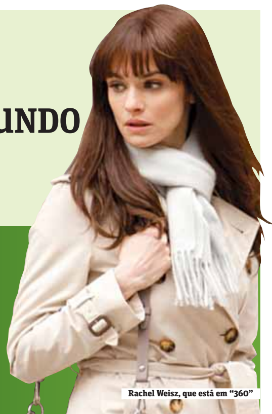
Rachel Weisz, que está em “360”

‘360’ A VOLTA AO MUNDO DE FERNANDO MEIRELLES {pág 14}